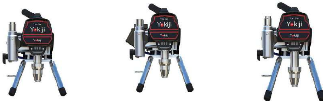
Yokiji YKJ320 / YKJ520 / YKJ720